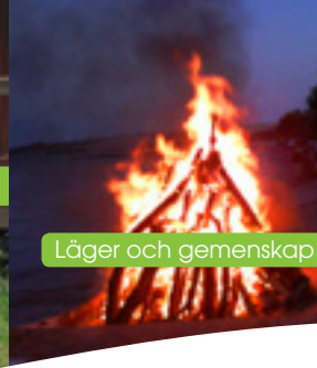
Läger och gemenskap