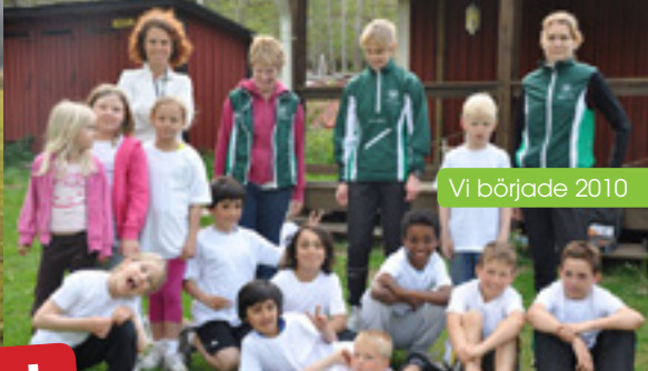
Vi började 2010