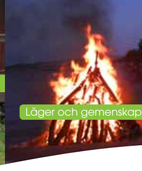
Läger och gemenskap