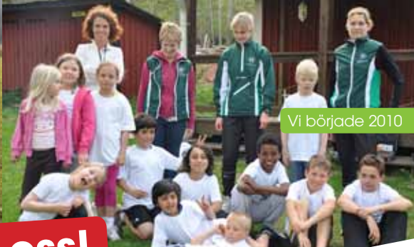
Vi började 2010